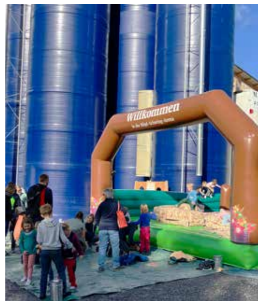
Die Hüpf-Schwing-Arena war auch am Tag der offenen Tür bei Felix Würth im Einsatz.

Das zusätzliche Luftpolster in der Arena ist ideal, um nach Stürzen und Würfeln weich zu landen, und beugt so Verletzungen optimal vor. Die Hüpf-Schwing-Arena ist schnell aufgebaut und mit der richtigen Technik auch zügig wieder abgebaut.